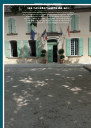
EP-03 les revêtements de sol

Au cœur de nos villes et villages, l'intérêt particulier et l'intérêt général doivent être conjugués pour créer le cadre de vie que nous y recherchons tous.