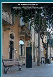
EP-02 le mobilier urbain