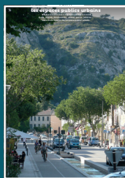
EP-01 les espaces publics urbains