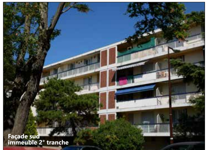
Façade sud immeuble 2° tranche