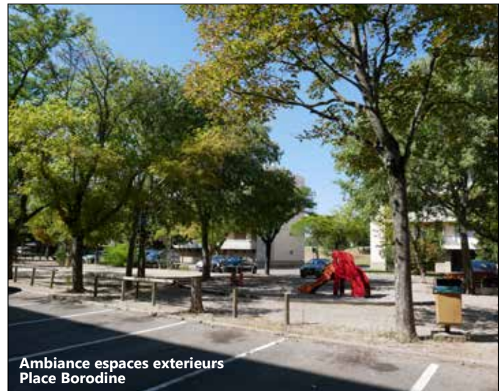
Ambiance espaces extérieurs Place Borodine

RUBRIQUE NON RENSEIGNÉE DANS LE CADRE DE L'ÉTUDE