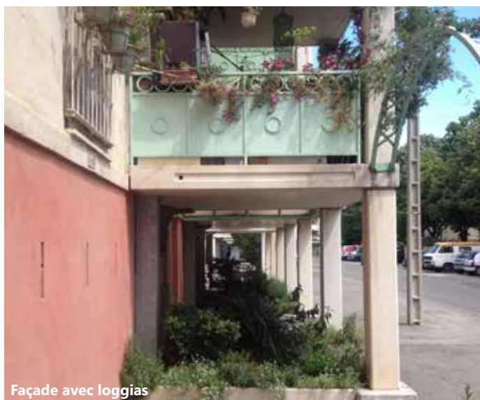
Façade avec loggias