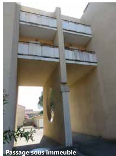
Passage sous immeuble