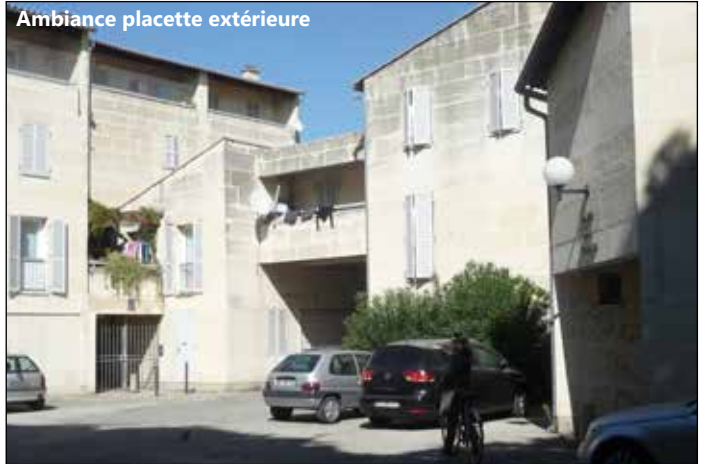
Ambiance placette extérieure