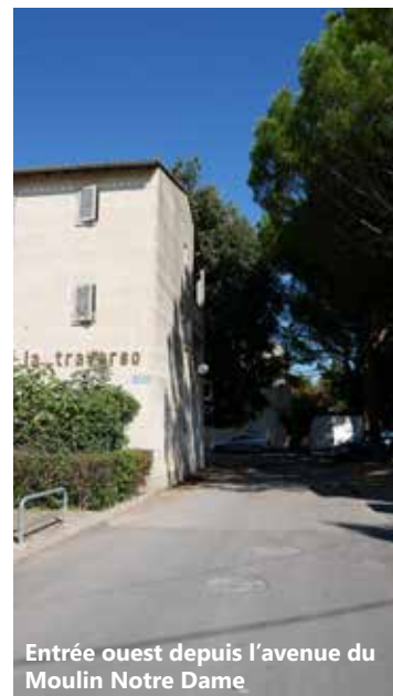
Entrée ouest depuis l'avenue du Moulin Notre Dame

BIBLIOGRAPHIE FLAURAUD, V. Avignon vingtième siècle . Éditions Bénézet 2009. GUERIN, R. Avignon X 2 e . Article non publié 2017.