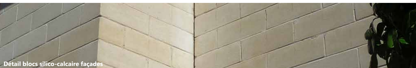
Détail blocs silico-calcaire façades