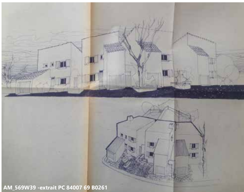
AM_569W39 -extrait PC 84007 69 B0261