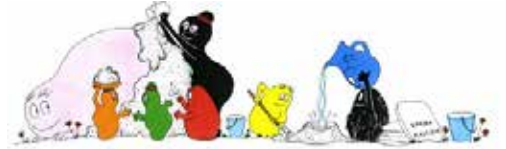
C'est la qu'ils construisent une maison à leur façon. Ils recouvrent Barbapapa de plastique.