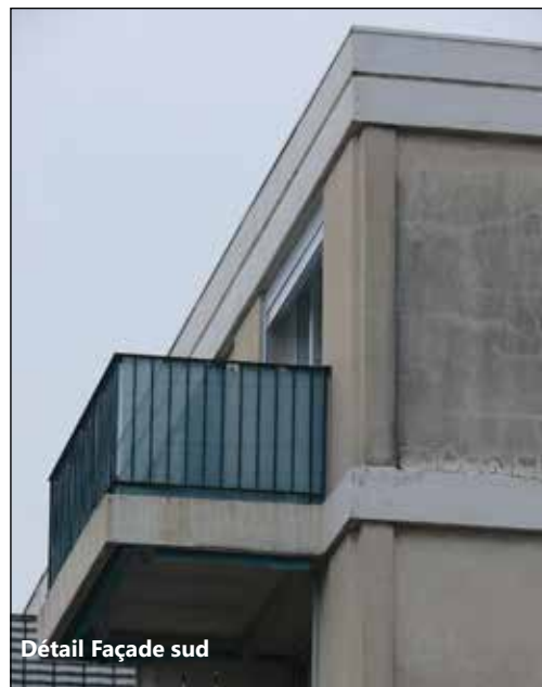
Détail Façade sud

BIBLIOGRAPHIE FLAURAUD, V. Avignon vingtième siècle . Éditions Bénézet 2009. GUERIN, R. Avignon X 2 e . Article non publié 2017