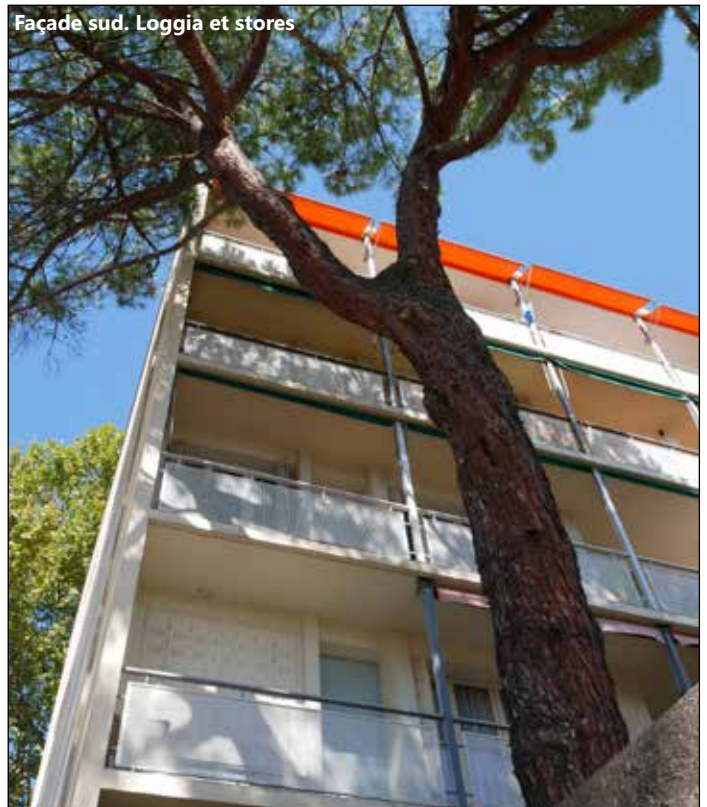
Façade sud. Loggia et stores

Serrurerie : garde-corps des loggias avec poteaux hauteur d'étage support de stores bannes et de parois séparatives.