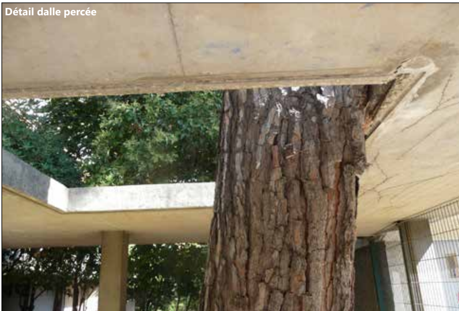
Détail dalle percée